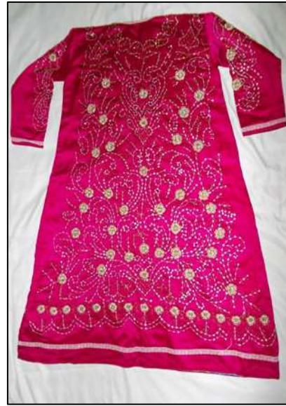
Balıkesir merkezinde ve köylerinde Manav olarak adlandırılan yerli ahalinin işlediği ve kullandığı Manav Pullusu.