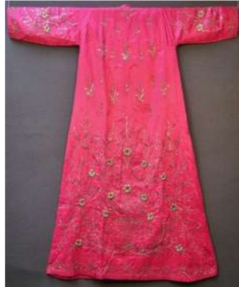
Balkanlardan göçen ve yörede Muhacir olarak adlandırılan ahali tarafından işlenen ve kullanılan Muhacir Pullusu (Dallı Pullu).

Balıkesir Pullusu'nda kullanılan malzemeler şöyledir: 1. Pamuk iplięi (Çile), 2. 50 numara beyaz dantel iplięi, 3. Sırma simler ve bakır renkli tırtıl, 4. Tırtıl renginde 12 numara kaneviçe yumaęı ya da fındık yumaęı, 5. Tırtıl, 6. El nakış makara simi, 7. Sarı metal pul, gümüş rengi metal pul, 8. Kumaş, 9. Kasnak, 10. Kasnak bezi, 11. Balmumu, 12. Mum bezi