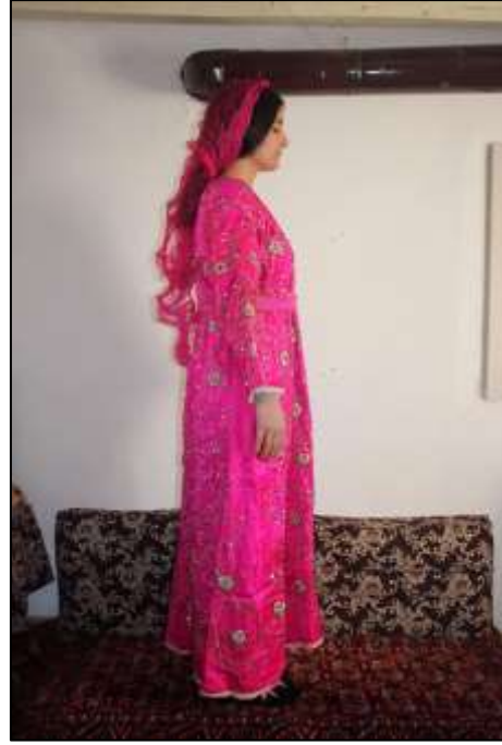
Alan arařtırmaları sırasında Balıkesir merkeze baęlı Yenice köy/mahallesinde tespit ettięimiz Özel ailesine ait yaklařık 100 yıllık Manav Pullusu.