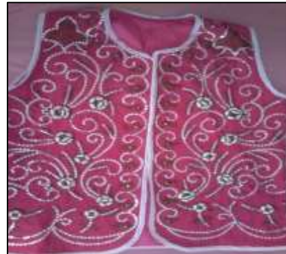
Manav ve Muhacir Pullusu teknikleri ile çalışılmış muhtelif ürünler.