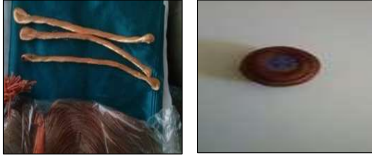
Balıkesir Pullusu malzemelerinden bazıları

Yapıldığı dönemlerde elbise olarak tasarlanan bu işleme teknikleri bugün sınırlı uygulama alanlarında olsa bile yalnızca geleneksel Balıkesir Pullusu ile sınırlanmayıp, günlük hayatta da kullanılacak farklı kıyafetler, takı, aksesuar, ev dekorasyon malzemeleri gibi oldukça görkemli ve ışılı ürünler yapabilmektedir. Bu ürünlerden bazı örnekler şöyledir: