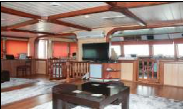
Bir başka açıdan kaptan köşkü