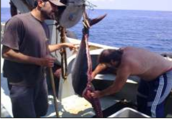
Akdeniz’de orkinos avında yemek hazırlığı