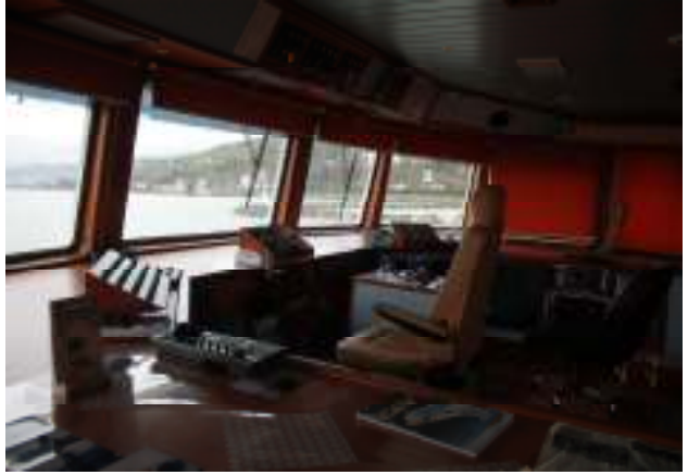
Akgün ailesinin avcı teknelerinden birinin kaptan köşkü