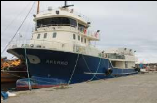
Akgün ailesinin iştirakçisi olduğu AKERKO adlı tekne