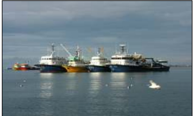
Akgün balıkçılık filosu Gürcistan'ın Poti Limanında